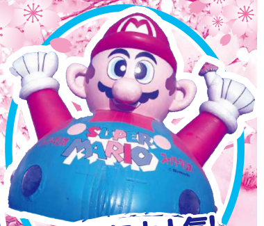
子どもに大人気! フワフワ 「スーパーマリオ」