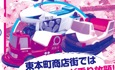
東本町商店街では バッテリーカーが乗り放題!